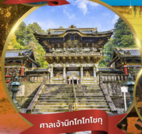
ศาลเจ้ามิกโกโทโทคุ