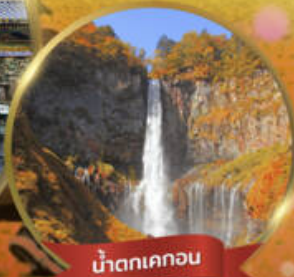
น้ำตกเคคอน