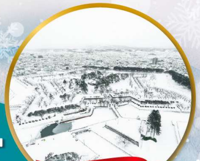
ป้อมโกเรียวกากุ