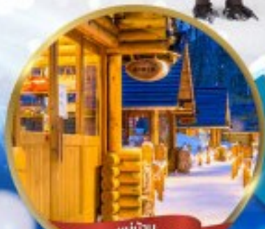
หมู่บ้าน NINGLE TERRACE

สนุกสนาน ณ ลานสกี • หมู่บ้านราเมนอาซาฮิคาว่า • หมู่บ้านนิงเกิลเทอเรส ขบวนพาเหรดเพนกวิน ณ สวนสัตว์อาซาฮิคาว่า • โรงงานช็อกโกแลต โอดารุ • ศาลเจ้าฮอกไกโด • พระใหญ่ HILL OF BUDDHA