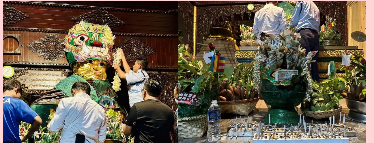
วิธีการขอพรจากแม่ยักษ์

พาท่านเดินไปขอพรที่ แม่ยักษ์ ผู้ปกป้องดูแลเจดีย์ คนพม่าเชื่อว่าแม่ยักษ์... จะช่วยในการตัดกรรมจากเจ้ากรรมนายเวร โดยเฉพาะอย่างยิ่งผู้ที่มีเวรกรรมกับเจ้ากรรมนายเวรทั้งหลายช่วยขจัดเคราะห์กรรม ขจัดอุปสรรค ติดขัดต่างๆ ความสำเร็จอธิษฐานขอให้ท่านช่วย ให้ชีวิตของคุณมีแต่ดีขึ้นเรื่อยๆ ซึ่งถ้าหากคุณกำลังมีทุกข์และหาหนทางไม่ออก ก็ลองมาไหว้ขอพรแม่ยักษ์ให้ช่วยบันดาลให้สิ่งร้ายๆ สิ่งไม่ดี ออกไปจากชีวิต และขอให้ชีวิตมีแต่สิ่งดีๆ เข้ามา นอกจากนี้ยังเชื่อกันว่าแม่ยักษ์... ยังช่วยเรื่องความมีชื่อเสียงโด่งดัง เป็นที่รู้จักก้าวหน้าในหน้าที่การงาน ใครที่ตกงานอยู่ จุดนี้เป็นอีกหนึ่งจุดที่ต้องห้ามพลาด ปล.แม่ยักษ์จะประดิษฐานอยู่ติดกับบันไดประตูทางทิศตะวันออกเฉียงใต้