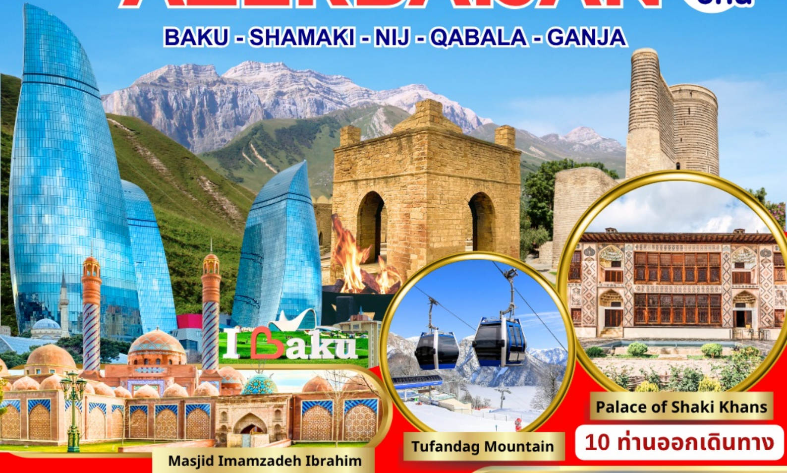
Masjed Imamzadeh Ibrahim