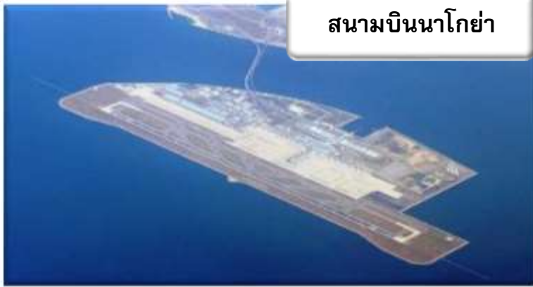
สนามบินนาโกย่า

เวลา 00.05 น. ออกเดินทางสู่ สนามบินนาโกย่า ประเทศญี่ปุ่น โดยสายการบินไทยแอร์เวย์ เที่ยวบินที่ TG 644