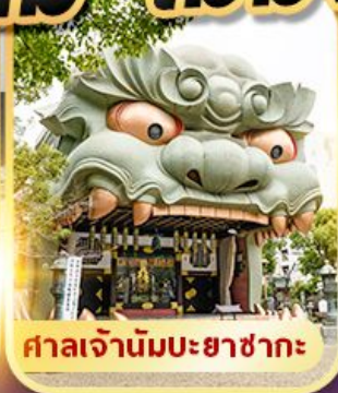
ศาลเจ้านิมมะยาซากะ