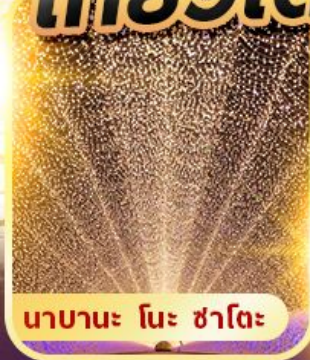
นาคานะ โนะ ซาโตะ