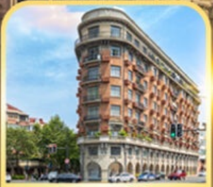
อาคารอู่คัง