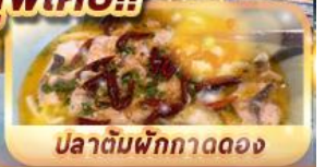
ปลาต้มผักกาดดอง