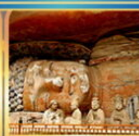
พาคืนพระแกะสลักต้าจู่