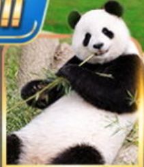
สวนสัตว์ฉงชิ่ง