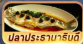
ปลาประจานาโรยดี