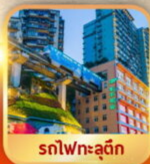
รถไฟฟ้าลัด