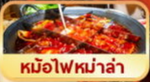
หม้อไฟหม่าล่า