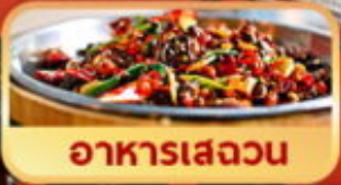
อาหารเสววน