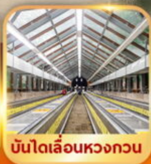
บันไดเลื่อนหวงกวน