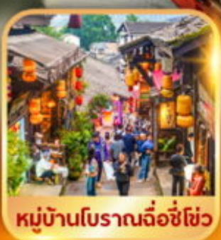
หมู่บ้านโบราณฉือชี่ฮั่ว