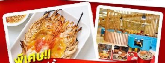
พิเศษ!! กึ่งแม่น้ำ + HOTPOT SEAFOOD