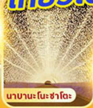
นาคานะ โนะ ซาโตะ