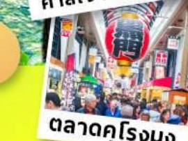
ตลาดคุโรมง