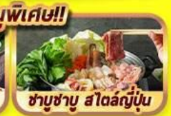
ชาบูชาบู สโตนญี่ปุ่น