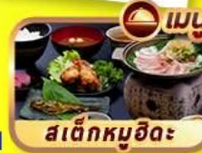
สเต็กหมูฮิดะ