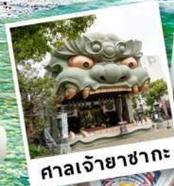
ศาลเจ้ายาซากะ

✓ 🏠 ที่พักในเมือง 1 คืน ใกล้ย่านช้อปปิ้ง