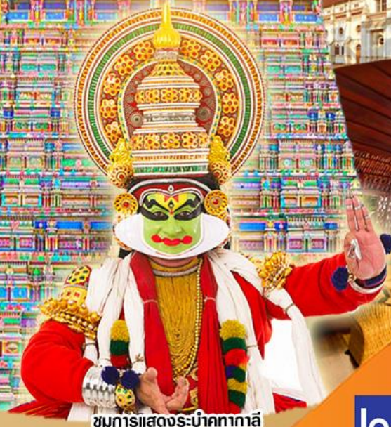
ชมการแสดงระบำคทากาลี