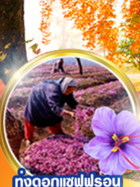
ทุ่งดอกแซฟฟรอน