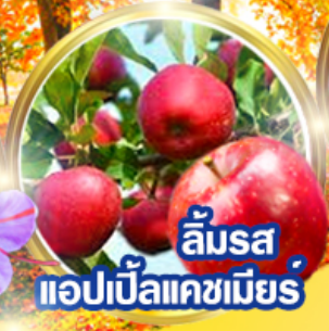
ลิ้มรส แอปเปิ้ลแคชเมียร์