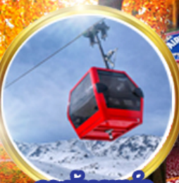
กระเช้ากุลมาร์ค ชมวิวสุดอลังการ