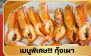
เมนูพิเศษ!!! กุ้งเผา