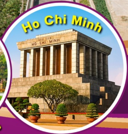
Ho Chi Minh