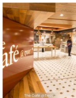
The Cafe @ 270 CAFE 270