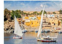
Option ล่องเรือเฟลกะ หรือ ล่องเรือชมหมู่บ้าน Nubian Village

** พักที่ Royal Beau Rivage Nile cruise 5* หรือเทียบเท่า **