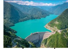
เซ็อนเอนกูรี