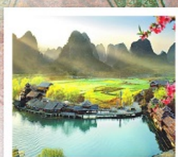
เมืองลิบแล