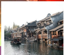
เมืองโบราณผานหลงกู่เจิน