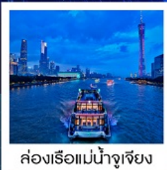
ล่องเรือแม่น้ำจูเจียง

ล่องเรือแม่น้ำจูเจียง / ช้อปปิ้งถนนปักกิ่ง / ช้อปปิ้งถนนซ่งเซี่ยจิว / วัดโหลหนัน / ศาลเจ้าตระกูลเฉิน / ถนนคนเดินหย่งซิงฟาง