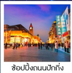
ช้อปปิ้งถนนปักกิ่ง