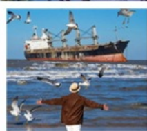
เรือบลูอิส