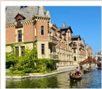
เวนิสแห่งต้าเหลียน