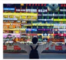
กำแพงมหาวิทยาลัยเหยียนเปียน