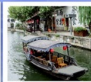
เมืองโบราณหนานสวิน