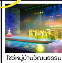
โชว์หมู่บ้านวัฒนธรรม