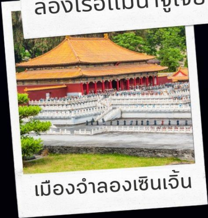
เมืองจำลองเซินเจิ้น