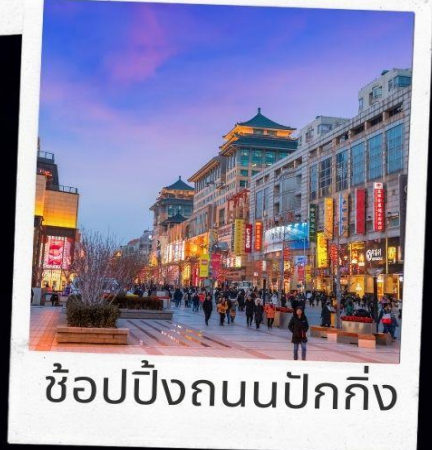
ช้อปปิ้งถนนปักกิ่ง