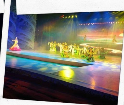
โชว์หมู่บ้านวัฒนธรรม