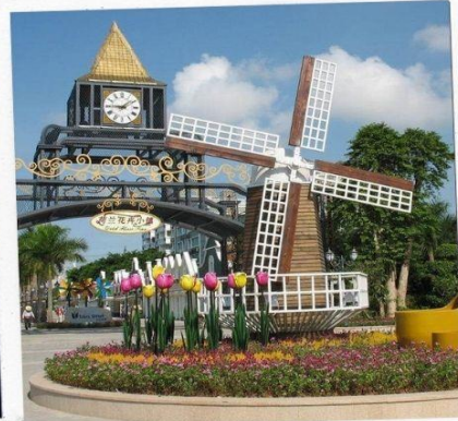
สวนดอกไม้ฮอลแลนด์