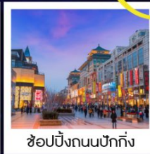
ช้อปปิ้งถนนปักกิ่ง