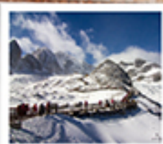
ภูเขาหินมังกรหยก

ลาดิยสถานออก / ไร่จางอวี่ใหม่ / เมืองโบราณเซี่ยงไฮ้ / วัดลามะซงจันหนิง / ช่องแคบเสียดูร์โรว์ เมืองโบราณรุ่งทอ / ภูเขาหินมังกรหยก / ภูเขาพระจันทร์สีน้ำเงิน / ไร่จางอวี่ใหม่ สะพานแก้วสี่เจียง / เมืองโบราณสี่เจียง ต๋านหนิงทง / วัดหยวนทง