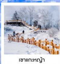
เขากระหลว้า