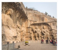
กำหินหลงเหมิน