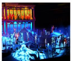
โรงละคร ONLY HENAN