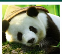
ศูนย์หมีแพนด้า