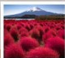
สวนโอะฮิชิ ป่ารัก

วัดเมียวโตะจิน / ถนนเมียวโตะจิน โฮโมเตะชินโด / พิพิธภัณฑ์ชิราคาวาโกะ / ซินมาชิ ซูจิ / คามิโกจิ / สะพานกินปะ / สวนโอะฮิชิ ป่ารัก ตู่มงกิบอนเน็ค / โอชิโนะ ฮักโท / สวนโอะวะคิเนน / วัดอาซากุสะ ตลาดปลาซึกิจิ / ฮอนเม็งฮินจุกุ / มิดซุบะ เฮอท์เล็ท พาร์ค คิซารุชิ