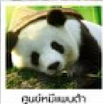
ดูแม่กบิ๊ตเตนต้า

อุทยานหวงหลง / อุทยานจิ่วจ้ายโกว / ไร่วิทิลิตตุนม่อฮุนกั๊กมีเพนต้าตุงเจียงเซี่ย / สวนดอกไม้ทิ่กู๋ / ระเบิดงิ้ว / ถนนถนนเดินสูบฮี้ตุง / ถนนโบราณซันหนี่