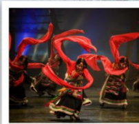
โชว์ทิเบต