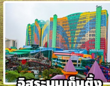
อิสระบนเก็นติ้ง