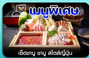
เชิเตาบุ ซาซู สีสึญี่ปุ่น