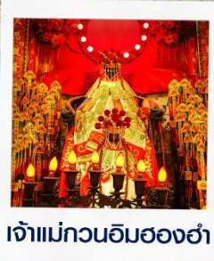
เจ้าแม่กวนอิมสองอ้า