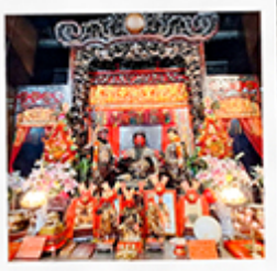
วัดเทพเจ้ากวนอู