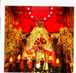
เจ้าแม่กวนอิมสองฮา