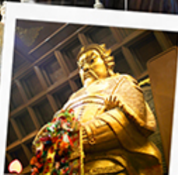
วัดเชกงกหมีว