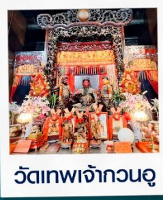
วัดเทพเจ้ากวนอู