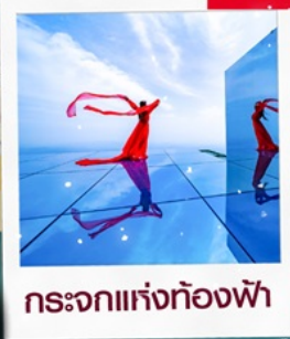
กระเจ๊กท้องฟ้า