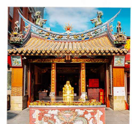
วัดเสี่ยวไท่เจิ้งหวง