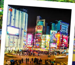
ช้อปปิ้งซีเหมินติง