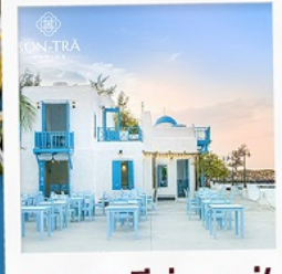
ซานตารีนาคาเฟ่