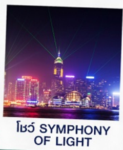
โชว์ SYMPHONY OF LIGHT