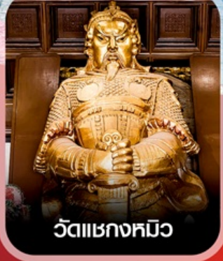
วัดเขกทมิว