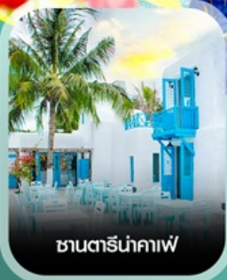
ซานโตรินาคาเฟ่

✈ คอนเฟิร์ม ออกเดินทาง ทุกพีเรียด 2 ท่านขึ้นไป