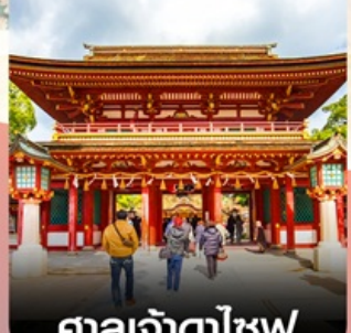
ศาลเจ้าดาไซฟุ