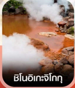
ชินอิเกะจิกุ

✈️ คอนเฟิร์ม ออกเดินทาง ✈️ ทุกพีเรียด 2 ท่านขึ้นไป