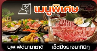
บุฟเฟ่ต์นานาชาติ เซ็ตปิ้งย่างยากินิกุ

ฟุกุโอกะ-วัดนันโซอิน-หมู่บ้านยูฟูอิน-แบบบุ-บ่อนรกจิกุ-แช่ออนเซ็น-ช้อปปิ้งเกนจิน-พักใกล้แหล่งช้อปปิ้ง2คืน