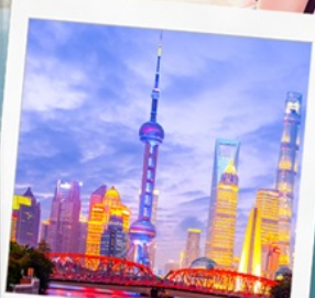
ทิวทัศน์