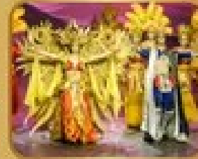
ชมการแสดงโขน/ละคร