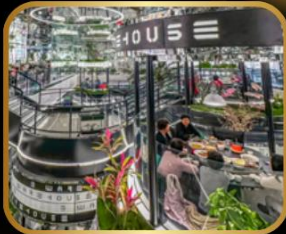
ภัตตาคารชื่อดัง WAREHOUSE NO.3