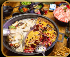
พิเศษ! เมนูหม้อไฟ สุกี้ หม้อไฟสไตล์จีน