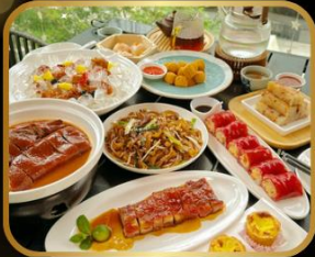
อาหารระดับ มิชลิน TAO TAO JU